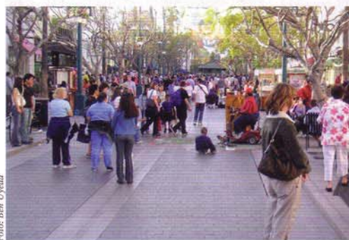
Third Street, Santa Monica, 2002

Bei der Vermarktung von Regionen spielen die Architektur und die Stadtplanung eine zentrale Rolle als charakteristische Besonderheiten, die über das Potenzial verfügen, Anwohner, Unternehmen und Touristen anzuziehen. Während die Errichtung von kulturellen Monumenten seit den neunziger Jahren eine weit verbreitete Brandingstrategie ist, dient die Errichtung von „Marktplätzen“ - eine Strategie, die aus den späten siebziger und frühen achtziger Jahren stammt - als deren kommerzielles Gegenstück. Auf diesen sogenannten Marktplätzen werden im Allge-