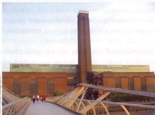
Tate Modern, London Architekten: Herzog & de Meuron

Architektur als Marke muss somit mehr sein als nur ein Markenprodukt, mehr, als eine bloße Implementierung klischeehafter Bildwelten, schon allein, weil Architektur eine viel höhere Verweildauer hat. So muss es vielmehr darum gehen, das Potenzial der Architektur als Marke als einen zeitüberdauernden Kommunikationsprozess, als Mittel zur Bildung einer nachhaltigen Identität, zu begreifen, welches sich durch profunde Öffentlichkeit auszeichnet und unseren Lebensraum mehr als jedes andere Produkt in unvermittelter Weise definiert. ■